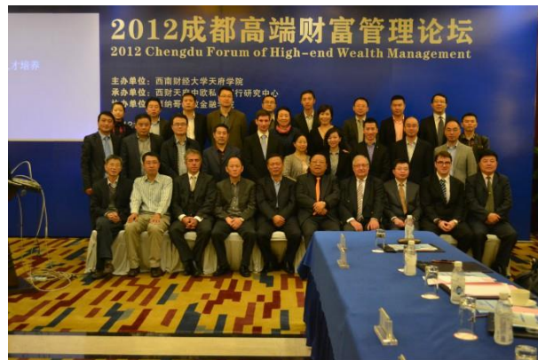
2012年10月, 成都, 成功主办成都高端财富管理论坛

国际私人银行专业方向作为学校产教融合典范, 强化教学实践无缝对接, 整合国内外金融标杆企业, 通过国内外校企合作网络建设, 打造一流的实战培养环境, 从而保证本专业方向国际化复合型实用人才的培养目标的达成。本专业方向学生从大三寒假开始, 均有机会进入国内外金融标杆实体机构实习。