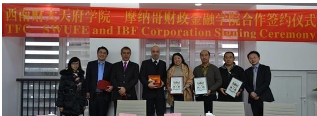
2013年4月，我校代表到访摩纳哥金融行业协会（AMAF）

西南财经大学天府学院国际私人银行专业方向是国内高校首个针对以私人银行为代表的高端财富管理领域进行国际化复合型人才培养的专业方向。专业方向直面国内私人银行专业人才缺乏的现实痛点，传承光华财经人才培养传统，戮力创新，采用“借助外脑，依托高端”的思路，与摩纳哥金融行业协会（AMAF）合作，基于欧洲院校联盟（FEDE）的框架，引进世界银行业中心地区——摩纳哥公国的私人银行人才培养体系，积极延揽海内外金融标杆机构，倾力打造专业方向领域的比较优势和教育服务品牌。从2012年发轫至今，国际私人银行专业方向已成为产教融合国际化金融实用型人才培养典范。