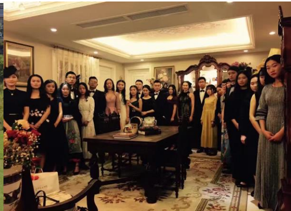
国际私人银行专业方向 2014 级高尔夫、时尚造型课程考核