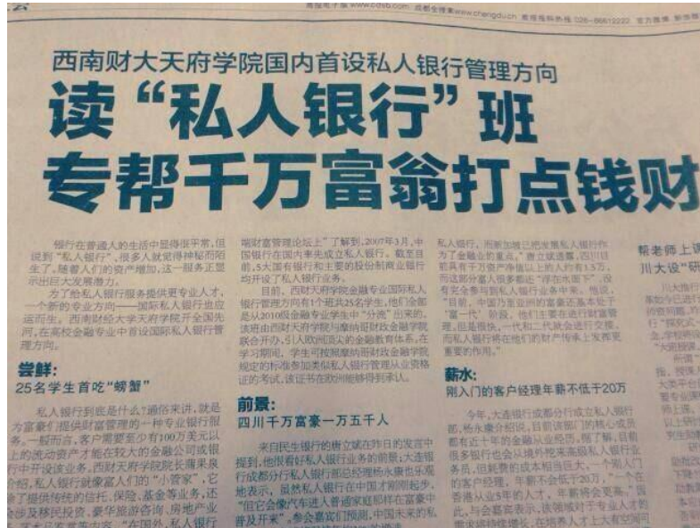
2012年10月20日，成都商报专题报道国际私人银行专业方向

作为全国高校第一个专门针对以私人银行为代表的高端财富管理领域进行国际化人才培养的教育项目，国际私人银行专业方向旨在培养中国未来的私人银行家。7年来，已培养输送两百余名专业人才，活跃在高端财富管理各分支领域。本专业方向现已有较强行业知名度与认可度，成为国内私人银行人才培养的学院派典范。