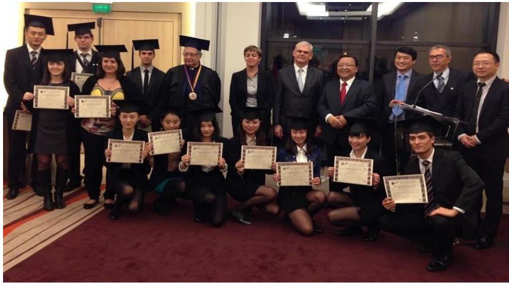
2013年11月，摩纳哥，国际私人银行专业方向

西南财经大学天府学院国际私人银行专业方向是国内高校首个针对以私人银行为代表的高端财富管理领域进行国际化复合型人才培养的专业方向。专业方向直面国内私人银行专业人才缺乏的现实痛点，传承光华财经人才培养传统，戮力创新，采用“借助外脑，依托高端”的思路，与摩纳哥金融行业协会（AMAF）合作，基于欧洲院校联盟（FEDE）的框架，引进世界银行业中心地区——摩纳哥公国的私人银行人才培养体系，积极延揽海内外金融标杆机构，倾力打造专业方向领域的比较优势和教育服务品牌。从2012年发轫至今，国际私人银行专业方向已成为产教融合国际化金融实用型人才培养典范。