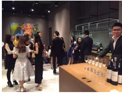
2016 年 4 月，成都，国际私人银行专业方向