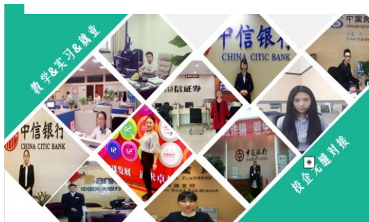
国际私人银行专业方向同学在各大金融机构实习就业