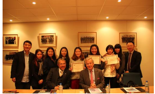
2014年11月, 摩纳哥, 国际私人银行专业方向2011级同学拜访

西财天府中欧私人银行研究中心主要承担学院“国际私人银行”专业方向的具体建设实施, 面向国内外相关产业领域, 积极推进产学一体化人才培养工作, 并以此为高端财富管理产业发展助力。