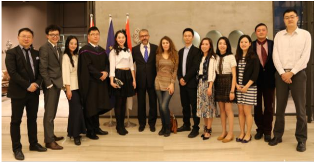
2016年4月, 成都, 国际私人银行专业方向在蓉中外教师合影