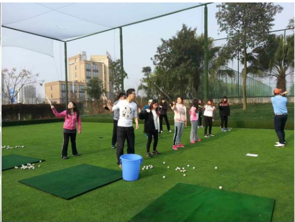
国际私人银行专业方向 2013 级葡萄酒、高尔夫课程