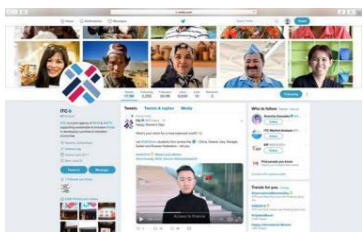
ITC“国际妇女节”公益视频